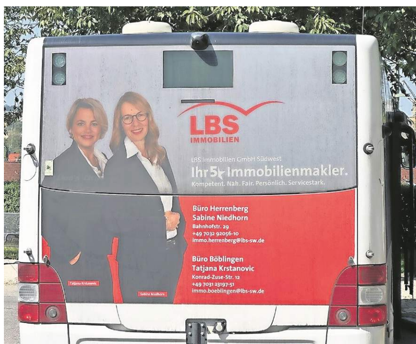
Ein Rundum-sorglos-Paket verspricht die LBS Immobilien GmbH.

Die über 120 Spezialisten der LBS Immobilien GmbH Südwest in Baden-Württemberg und in Rheinland-Pfalz bringen jährlich über 4 000 Kunden in ihr neues Zuhause. Qualität und Fairness stehen dabei an